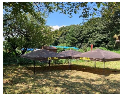
↑ 草刈りしていただいた城所公園

城所公園では、マイ竹コップ／竹皿をつくり、竹飯盒のごはんとBBQにみんなの笑顔があふれていました。